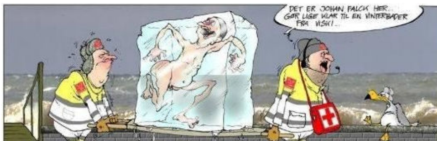
VISKI ON THE ROCK !

Omkvæd: Her i VISKI, det sociale liv i højsædet er hvilket tidsfordriv. Vinterbadet det er helt i top Det ultimative for sjæl og krop.